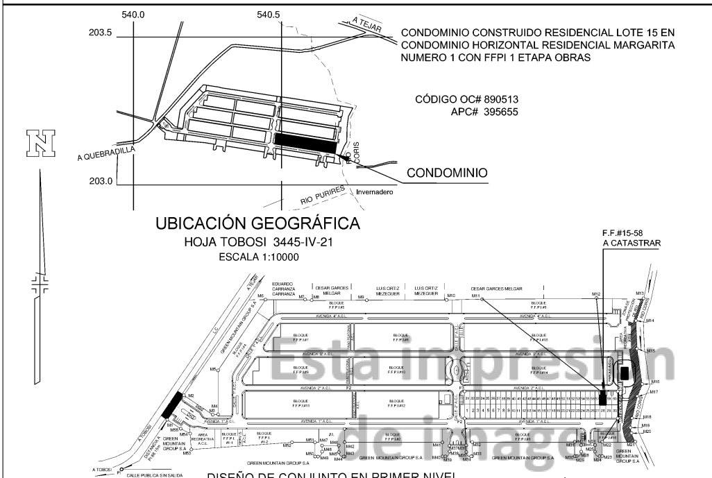
UBICACIÓN GEOGRÁFICA HOJA TOBOSI 3445-IV-21 ESCALA 1:10000