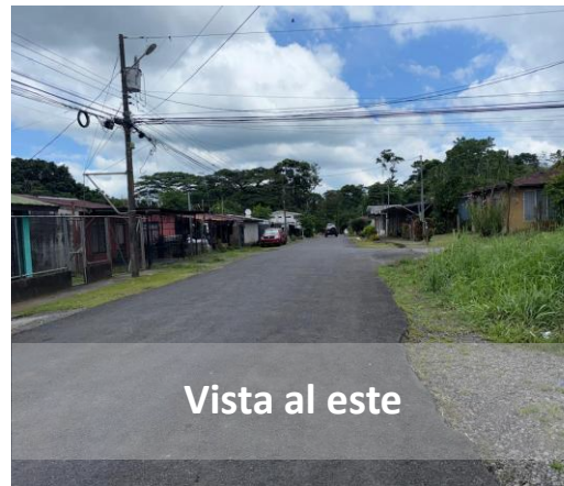
Vista al este