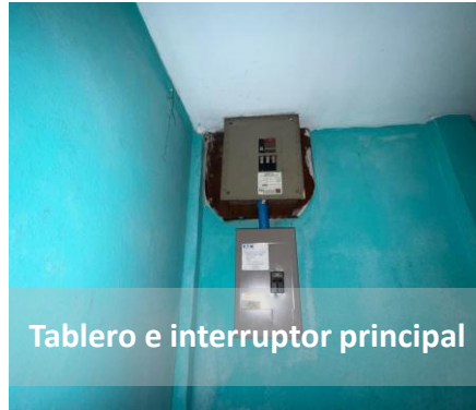
Tablero e interruptor principal