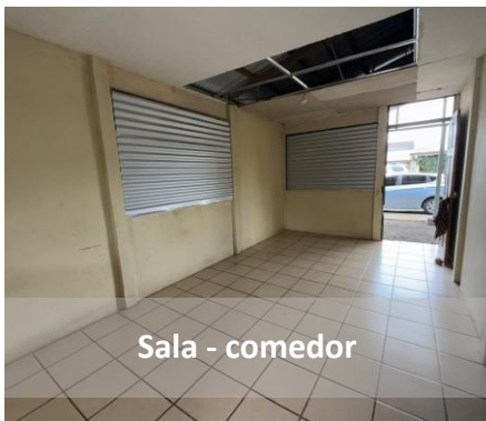
Sala - comedor