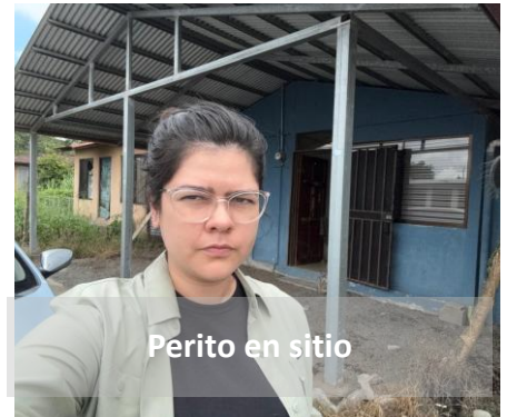
Perito en sitio