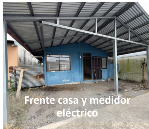
Frente casa y medidor eléctrico