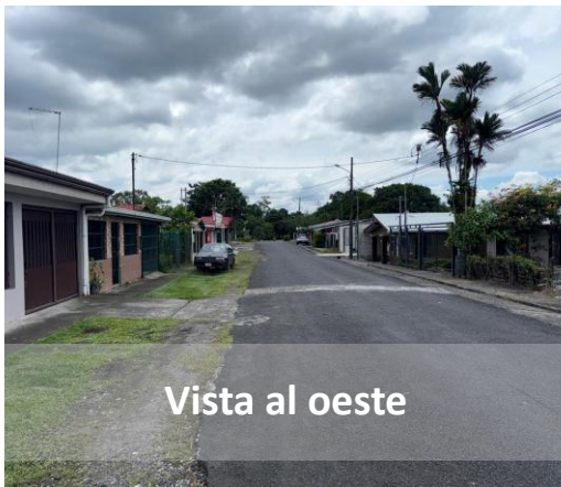
Vista al oeste