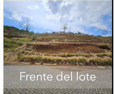
Frente del lote