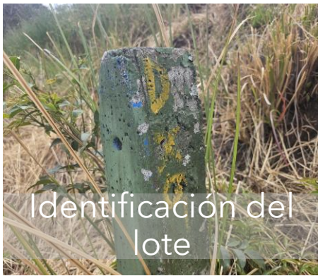
Identificación del lote