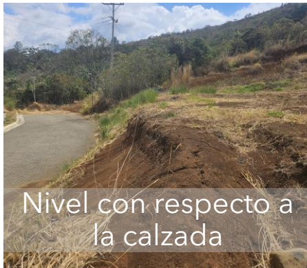
Nivel con respecto a la calzada