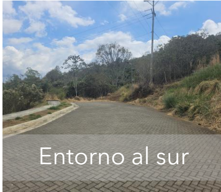
Entorno al sur