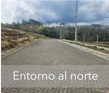
Entorno al norte