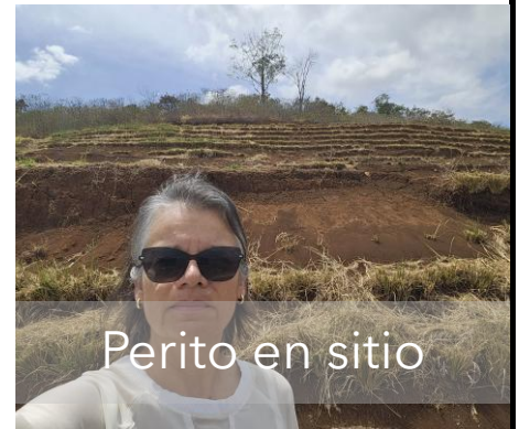
Perito en sitio