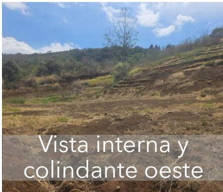
Vista interna y colindante oeste